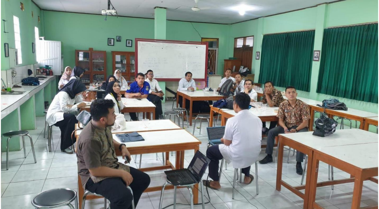
Dokumentasi kegiatan pembelajaran :